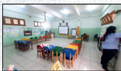
K1 Deer Class Putih-Hijau Pastel 7.5 x 7 meter