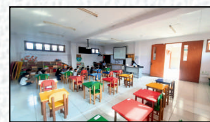
K2 Ladybug Class Putih-Ungu Pastel 7.5 x 10 meter