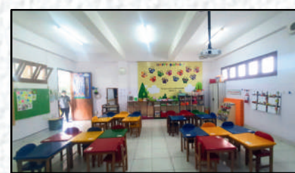
K2 Butterfly Class Putih-Ungu Pastel 7.5 x 7 meter