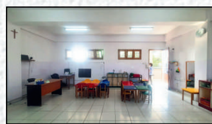
K1 Zebra Class Putih-Ungu Pastel 7.5 x 7 meter